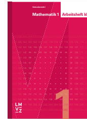
Mathematik 1 klick