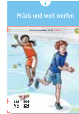
Präzis und weit werfen