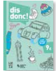
dis donc! 9